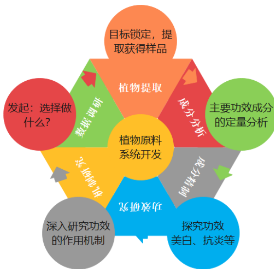
图 2. 植物原料的系统开发图