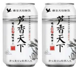
图 4. “芦香天下”系列饮品 (清热生津，除烦，止呕，利尿)