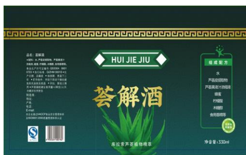
图 3. 以芦荟为原料的功能性产品 (发挥解酒保肝功效)